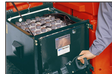
Batteria di trazione da 320 Ah, consente grande autonomia di lavoro e facile manutenibilità.

La regolabilità del sedile consente all'operatore un'ottima visuale sulla superficie da pulire.